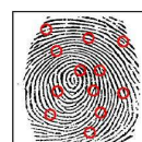
Points caractéristiques repérés par le logiciel appelés « Minuties »