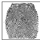
Image de l'empreinte lue par le capteur